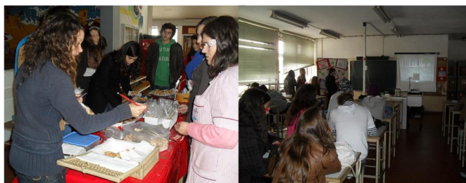
Venda dos "Laços Solidários" e palestras