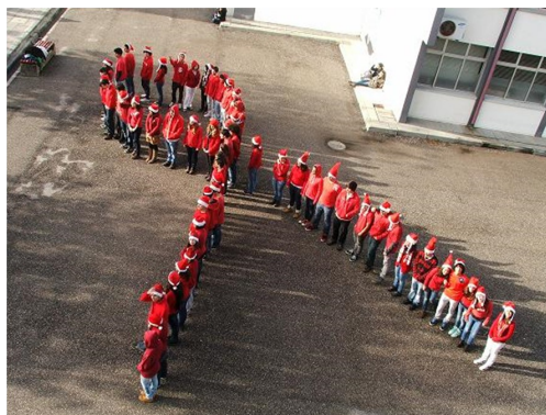
Laço Humano da Solidariedade